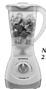
NL-22 – Power 2 2 Vel. Copo SAN