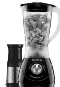
L-38 – Power 2 Black Filter 2 Vel. Copo SAN