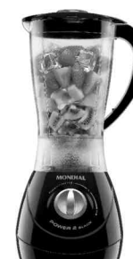
L-28 – Power 2 Black 2 Vel. Copo SAN