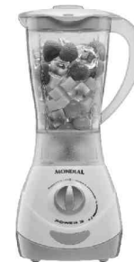
NL-32 – Power 3 3 Vel. Copo SAN