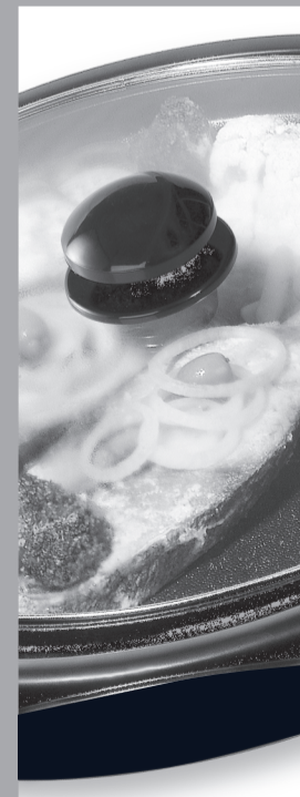
Grill com tampa