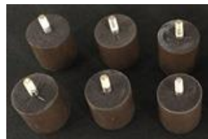
1 – 1 Jogo de pés

3º Deixe a cama na horizontal, com os pés para o chão.