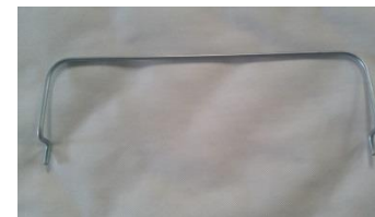
2 – Aramado